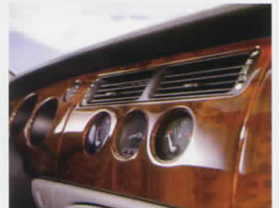
自動車のパネルやボデーの仕上げにも