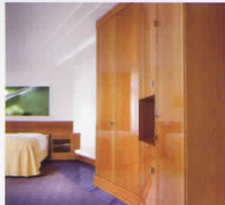
高級家具の仕上げにも