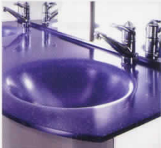
人造大理石の仕上げにも