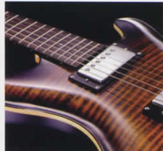
楽器の仕上げにも