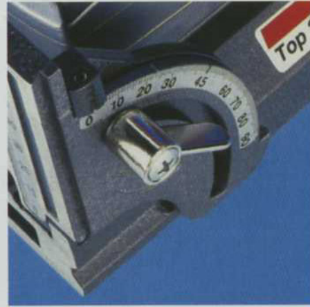
0度、22.5度、45度、67.5度、90度でのストッパーが付いているので、フロントベースの傾き設定が容易にできます。