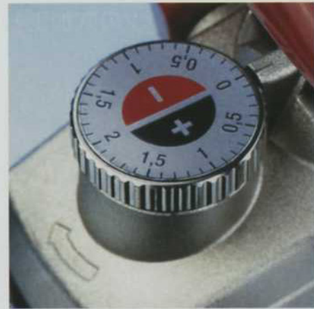
ブレードの高さをプラス・マイナス2mmの範囲で0.1mmきざみの設定ができます。(Top20形のみ)