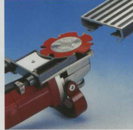
ワンタッチでフロントベース+ベースプレートが外せるので、プレートの交換や内部の清掃が容易にできます。