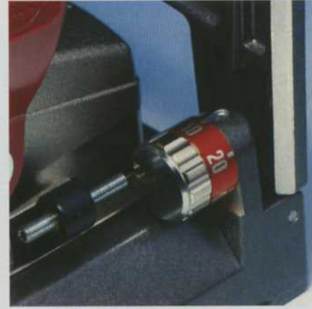
溝の深さが、ビスケット全種(0番、10番、20番、S6番、H9、S、D)に対応できるようになりました。