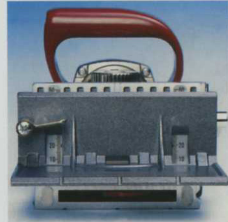
ストップスコヤは、フロントベース上で上下でき、ブレードと必ず平行になるように固定できます。フロントベースには、横滑り防止用のフラットパットが付いています。